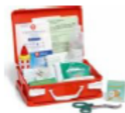
CASSETTA DI PRIMO SOCCORSO

Chiunque, quindi, si trovi a soccorrere una persona infortunata o colta da malore deve prestare la propria opera solo se certo dell'intervento da compiere e deve avvertire, in ogni caso, immediatamente, gli addetti al Primo Soccorso interno.