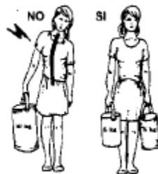
BILANCIARE SEMPRE I CARICHI